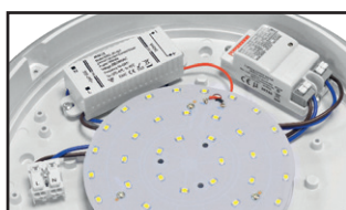
Connecteur rapide double entrée